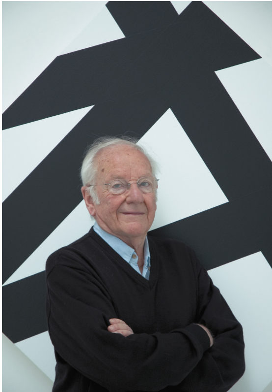
François Morellet Portrait, 2007