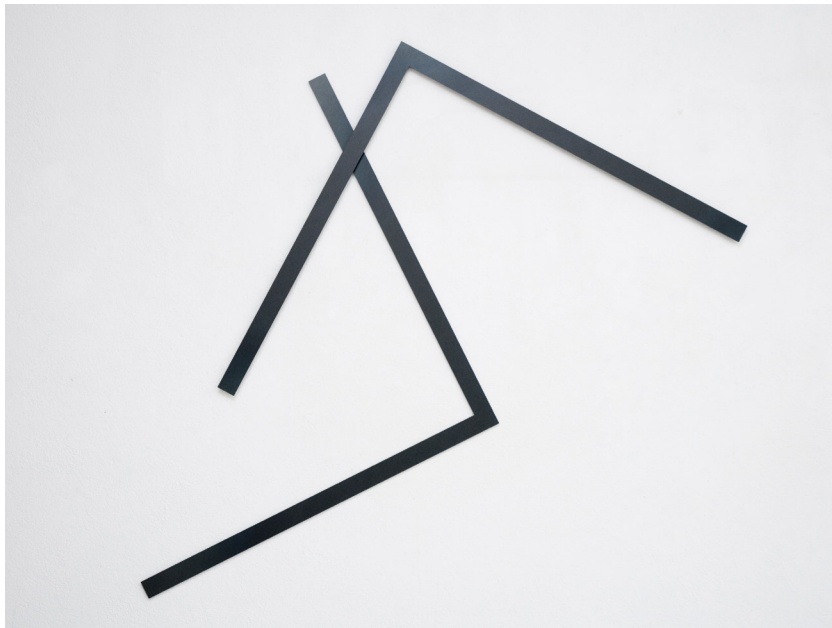
François Morellet Grands tirets 0°, 90° 1971 (c) Archives Morellet Courtesy Galerie Kamel Mennour Paris